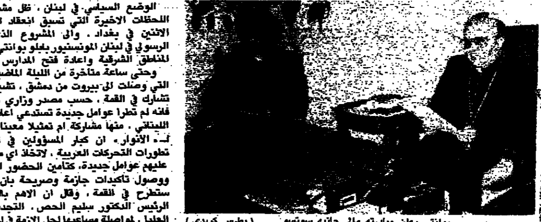
بوانتي يعلن مبادئه وان جانبه سوتسو (بطرس كبردي)

الوضع السياسي في لبنان، ظل مشدوداً الى تطورات المحطات الاخيرة التي تسبق انعقاد القمة العربية غداً الاثنين في بغداد. وان المشروع الذي طرحه الناصد الرسولي في لبنان المونسنيور بيلو بوانتي، لا يلقى القبول في المناطق الشرقية وإعادة فتح المدارس. وحسب سعادة متخارة من الليرة اللبنانية، فان المعلومات التي وصلت الى بيروت من دمشق، تشير الى ان سوريا لن تتدخل في القمة، حسب مصدر وزاري "عربي"، وبالتالي فانه لم تطرأ عوامل جديدة تستدعي إعادة النظر في الموقف اللبناني، منها مشاركة ام تحليلاً معينا، وأوضح المصدر ان الأتوار، ان كبار المسؤولين في تشاور دائم حول تطورات التحركات العربية، لاتخاذ اي موقف جديد، تعليمه عليهم عوامل جديدة، تكاميل بحضور العربي الإجماعي، ووصول تأكيدات جازمة وصريحة بان القضية اللبنانية ستطرح في القمة، وقال ان الامم بقنسة الى حكومة الرئيس الدكتور سليم الحص، التجديد لجهة العربية العليا، بواسطة مساعدها لحل الأزمة في لبنان، لانه من دون